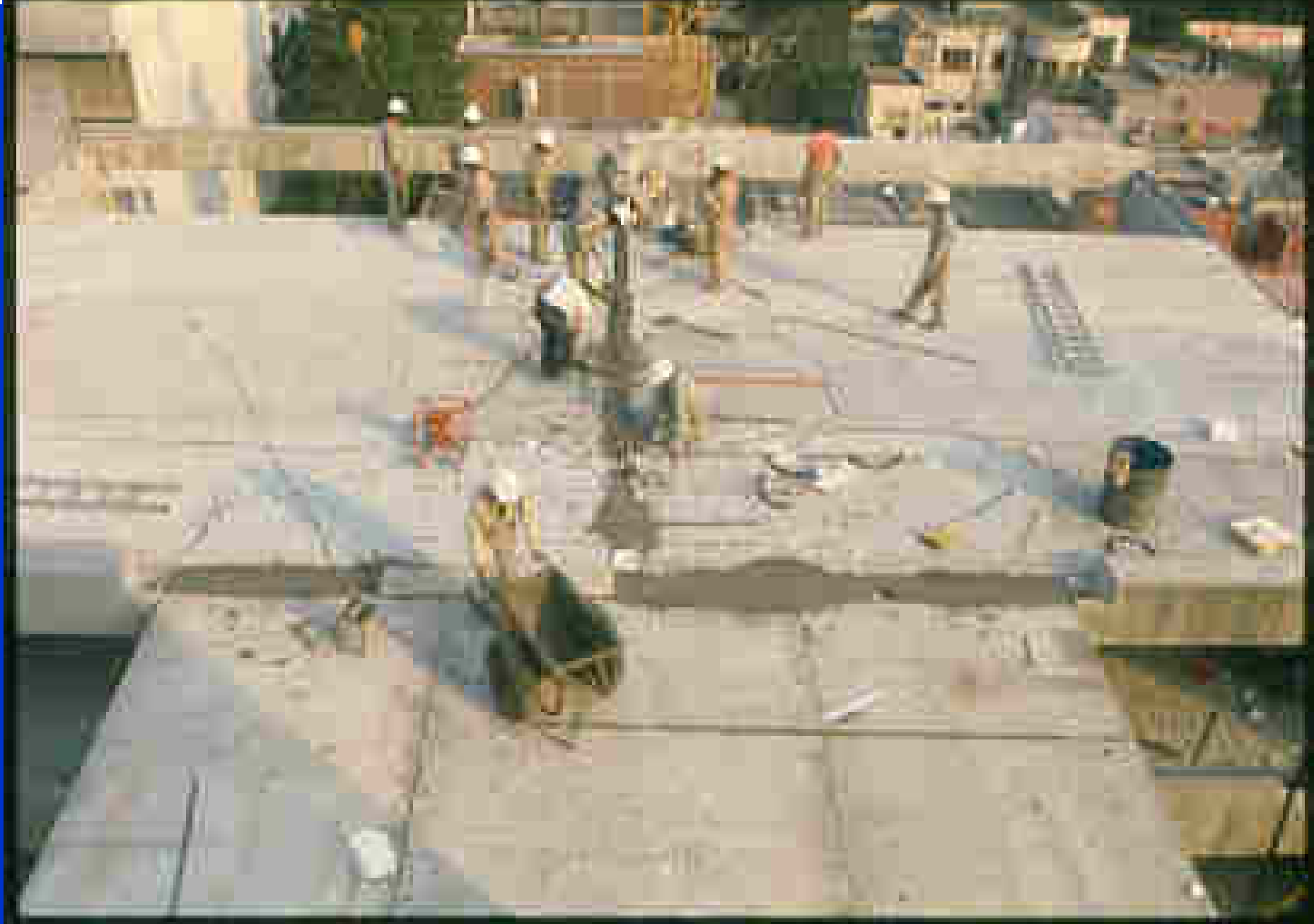
COLADO DEL CERRAMIENTO, SOBRE LA CANAL PRECOLADA